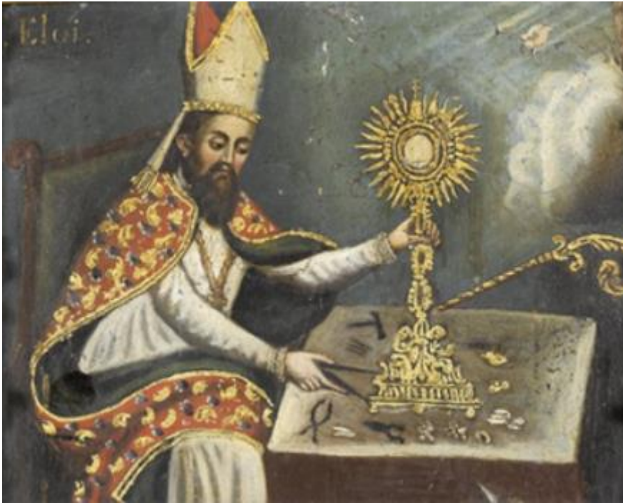
Sint Elooï als goudsmid

te horen, dat haar zoon een belangrijke rol in de kerk zou spelen. De meeste legenden zijn echter rond zijn werk als smid.