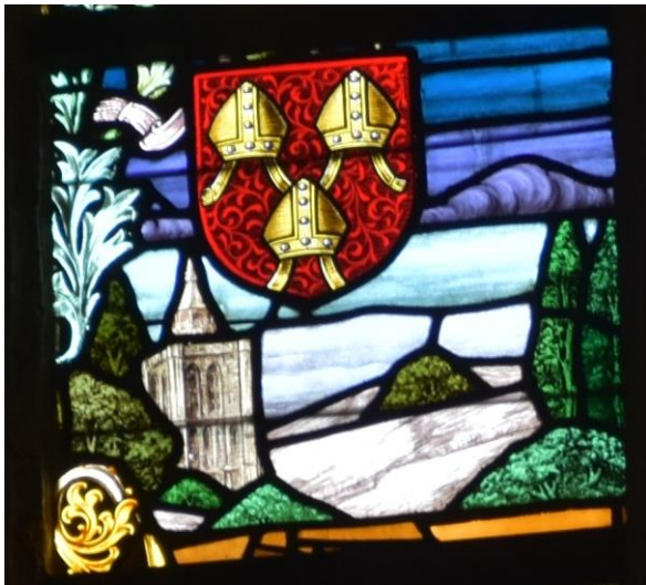
Het schild van Terwaan – van het brandglasraam in de Sint Janskerk – zoals de heer Adriaen het beschrijft

De Phenicieërs, Griekse bezetting van de Oostkant van Azië, in de geschiedenis bekend voor hun vernuft om handel te drijven en voor hun zeetochten, wisten dadelijk er gebruik van te maken om met hun schepen de kusten van Italië, Spanje, Frankrijk, zelfs van de Atlantische Oceaan aan te landen, koopwaren met de bewoners te verhandelen en dezen de kennis van geld aan te leren. Gelijk olie op papier werd dit door geheel Gallië rond verspreid. Ter plaatse gemaakt zijn de beeltenissen misvormd, gedeelten zijn achtergelaten, soms barbaarse tekeningen dringen zich op, waarin de eerste verbeeldingen moeilijk te herkennen zijn. Zo sloeg men het eerste geld in het Morinenland.