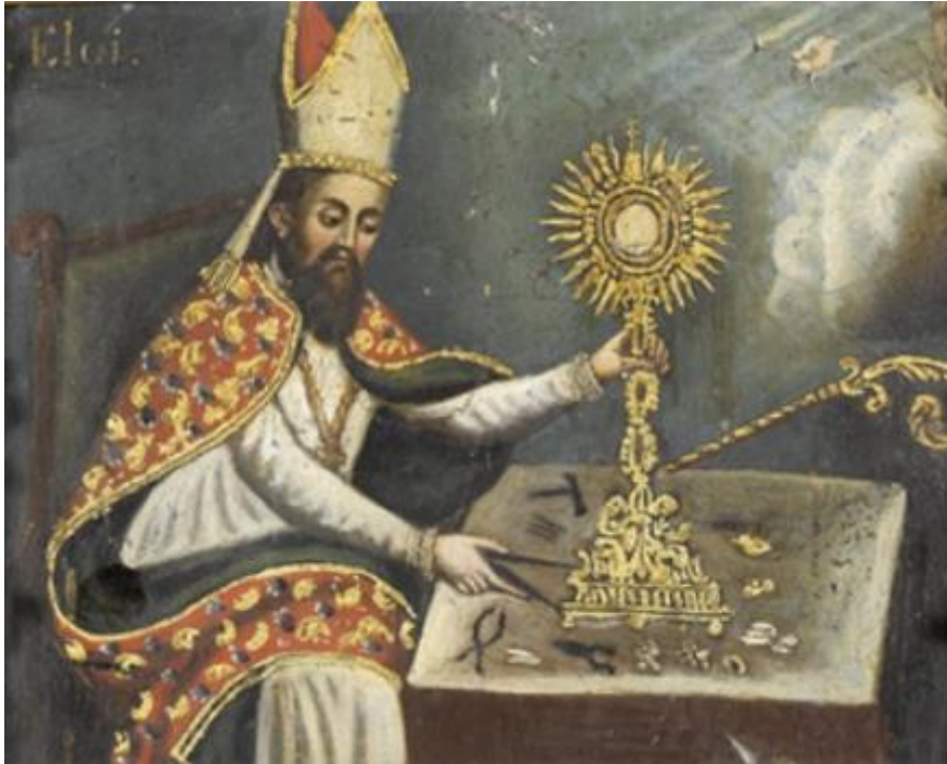
Sint Elooï als goudsmid