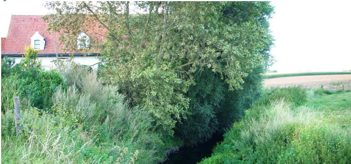
Het Duinhuis ligt wel heel kort tegen de 'vaart' aan.

De abten schijnen haastig te zijn om rond de jaren 1370 – 1400 in het Poperingse 't een stuk bosgrond naast het andere aan te werven. Dat getuigt van hun wakkere en zakelijke zin. Immers enige jaren te voren (1366) ondernamen de Poperingenaars grote water- en sluiswerken op de Vleterbeek om er de Poperingevaart van te maken. Die vaart liep van Poperinge door 't goed der abdij van Eversam – onder Stavele – over Westvleteren naar de Ijzer.