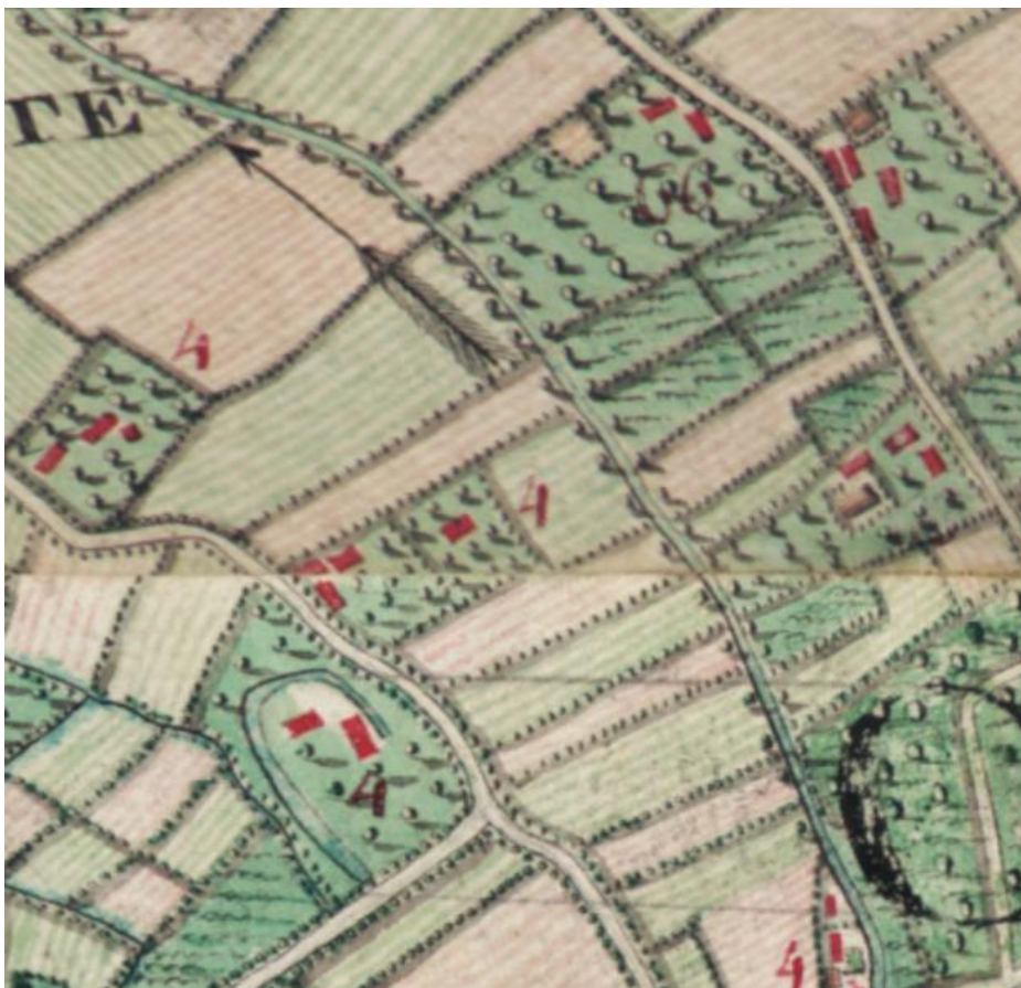
Ferraris - 1760

We merken op de Ferrariskaart uit 1760 dat het Duinhuis op een redelijke afstand van de vaart lag. Waar de 4 staat op de kaart zien we immers een geheel veld tussen de boerderij en de schipvaart.