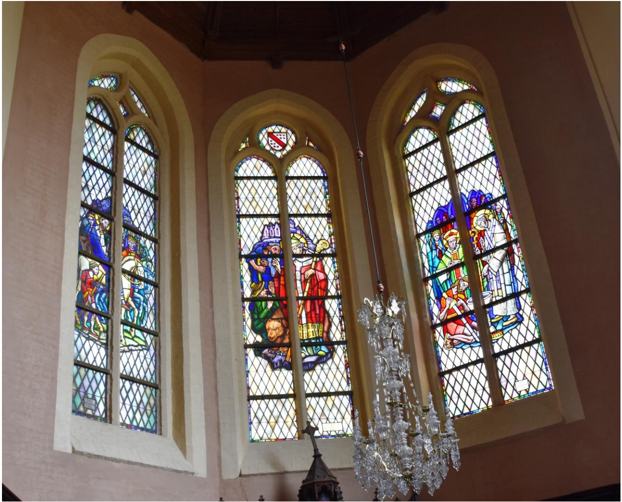
Het Vedastusaltaar in de kerk van Reningelst – met in het midden Vedastus met de beer en links is Vedastus catechismusles aan het geven aan Clovis.