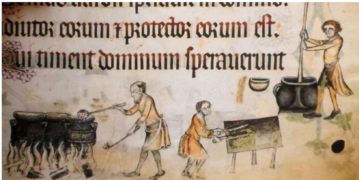
Uit de 'Luttrell psalmter' – begin 14de eeuw. Wat maken ze hier gereed?